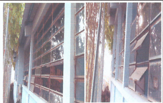
Foto 4: Área donde se contempla hacer el mejoramiento e instalación de balcones lado lateral aulas 1, 2 y 3.

Observación: Si es necesario se pueden agregar hojas adicionales y actualizar el número de hojas.