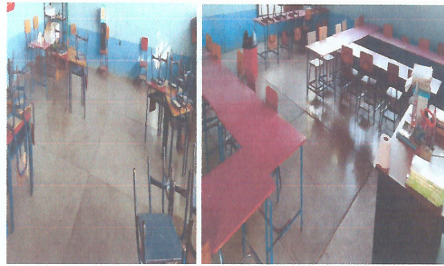
Foto 1: Área donde se contempla hacer el mejoramiento e instalación de piso cerámico Aula 1 y 2.