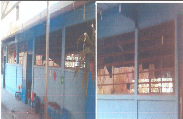
Foto 3: Área donde se contempla hacer el mejoramiento e instalación de balcones para los ventanales frontal aula 1, 2 y 3.